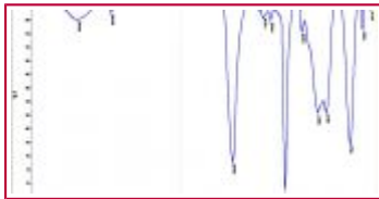
FTIR clear areas